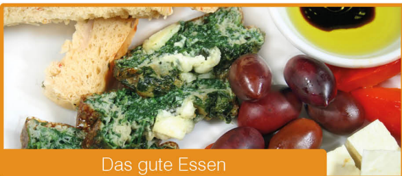
Das gute Essen

Auch eine psychosoziale Unterstützung ist für viele Ratsuchende wichtig. Daher ist unsere Qualifikation ganzheitlich und systemisch konzipiert und hat u.a. Themen wie Stressintelligenz, ZEN-Meditation, Heilkraft der Bewegung und Salutogenese im Programm.